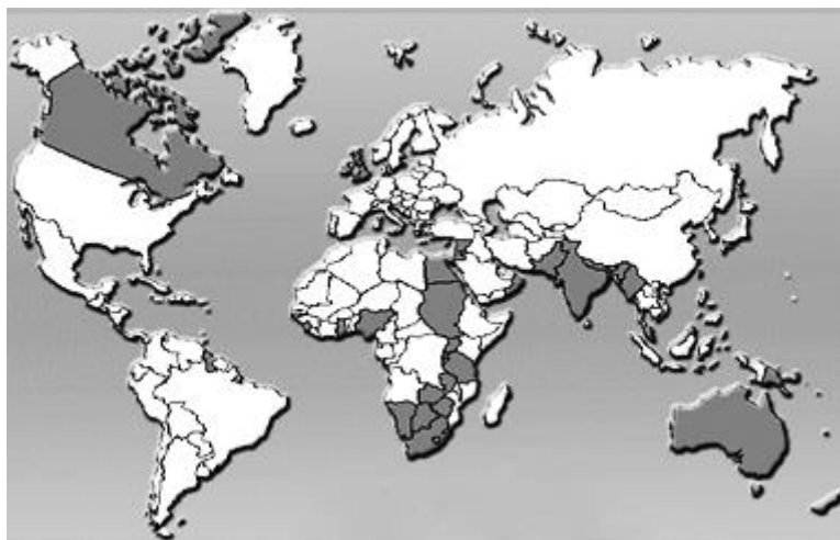
A XVIII. századi világ gyarmati felosztása